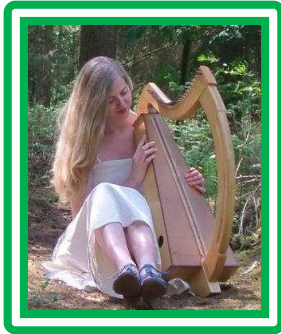
Foto: hedendaagse kopie van de Brian Boru harp

Het afbeelden van harpen op strijdvlaggen is lange tijd ook het symbool geweest van het Ierse verzet tegen de Engelse overheersing, eens iets anders dan een leeuw of een draak. Aan het Engelse hof vond men dit desalniettemin zo'n grote bedreiging dat men beval om alle harpen te verbranden en harpisten te executeren, zwartgroene tijden waren dat. Gelukkig hielden er enkele stand, maar het duurde nog zo'n 200 jaar vooraleer de harp weer in alle vrijheid kon weerklinken, the future is green!